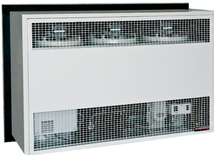
CKA 40 – från den varma sidan.