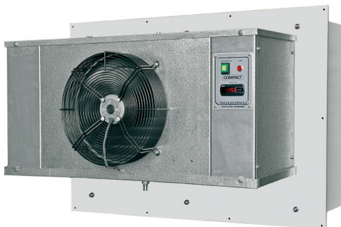
CKA 40 – från sin kalla sida.

Passar utmärkt till avfallsrum eller liknande med ett temperaturområdet på +3° – +12°C.